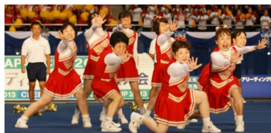
MJGチアリーディングクラブ BEAUTY BEARS